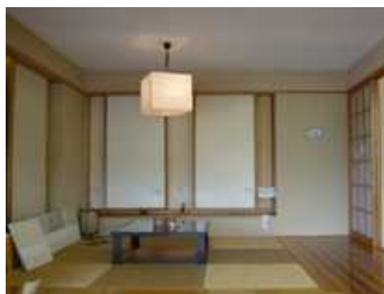
和室は掘り込み炬燵で長時間の座りも足が楽チンです！

気軽に持って帰って頂ける様、 カタログ棚を作りました 無垢フローリングの足ざわりを確認しながら お茶でも飲んで、お好きなカタログをお選び 下さい！！(@^ ^@)