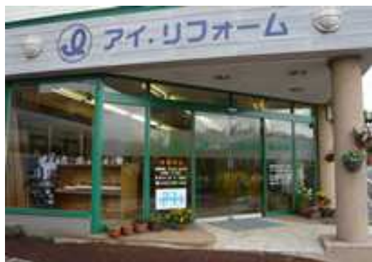
正面玄関に店舗案内を入れました！！