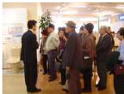
TDYショールームにて