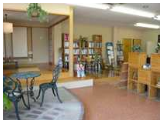
一度遊びに来てください

気軽に持って帰って頂ける様、 カタログ棚を作りました 無垢フローリングの足ざわりを確認しながら お茶でも飲んで、お好きなカタログをお選び 下さい！！(@^ ^@)