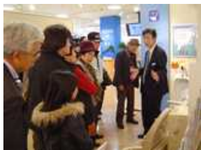
TDYショールームにて