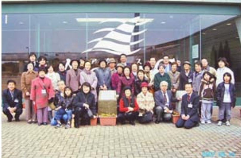
アクア入口にて全員で集合写真

3月10日アイリフォームとして、初めてのバスツアーを開催致しました。沢山の方にご応募頂いたのですが、定員の関係で抽選により30名の方にご参加頂きました。抽選にもれた皆様申し訳ありません。次回も是非ご応募下さい。何しろ、リフォームはプロでもツアーのお世話は素人のにわか添乗員 兼バスガイドですので、数だけは大勢いる割にはバタバタしましたが、ご参加の皆様の暖かいご理解のお陰で、最後まで楽しい一日となりました。ところで、能登半島で大地震が起きました。北陸地方ではかつて福井大震災がありました。今や日本中どこで起きてもおかしくない状況のようです。呉市でも昨年あたりから、建築士会等で木造建物の耐震改修についての最新の規準を講師を招いて、何度も研修会を行っており、我々も参加して勉強しております。毎日楽しく健康に過ごす為には、「備えあれば憂いなし」ですね。