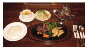
オススメの一品 牛ロースステーキ

リナズブルな価格で、良いものを提供してくれるお店です。記念日のディナーなどおすすめです。